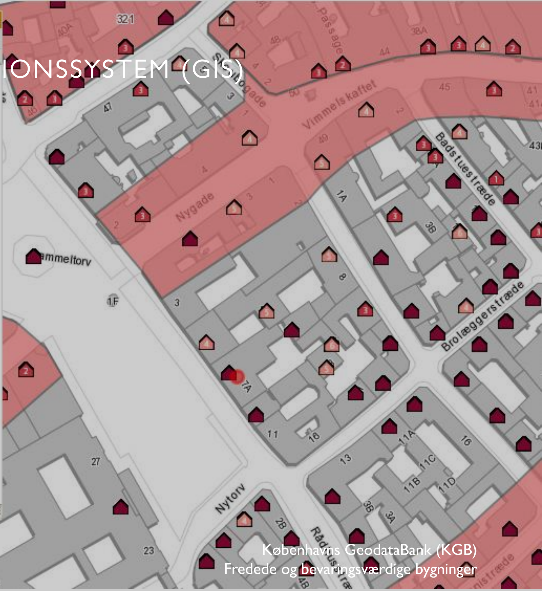
Københavns GeodataBank (KGB) Fredede og bevaringsværdige bygninger