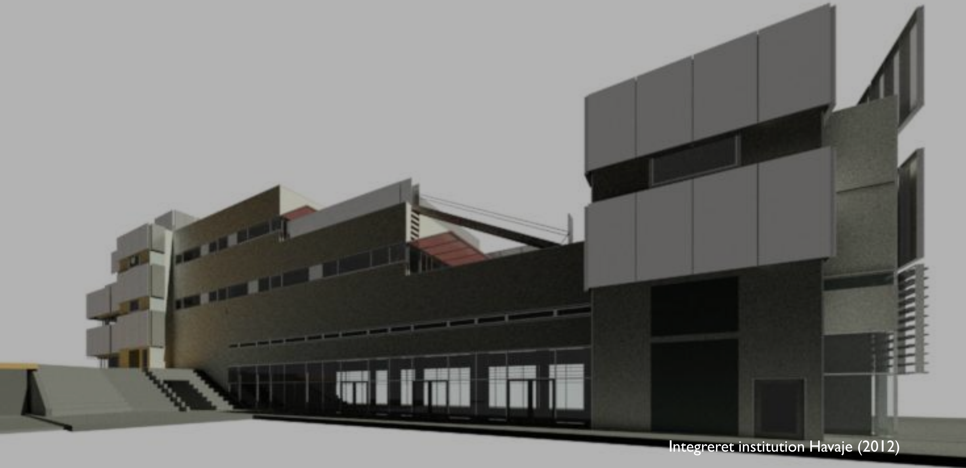
Integreret institution Havaje (2012)